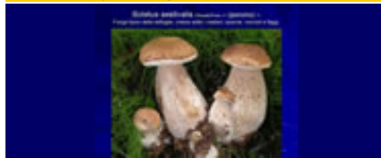
foto e breve descrizione di alcune specie fungine a cura di Vassuri Mario

alcuni consigli a cura del Soccorso Alpino e Speleologico Lombardo.